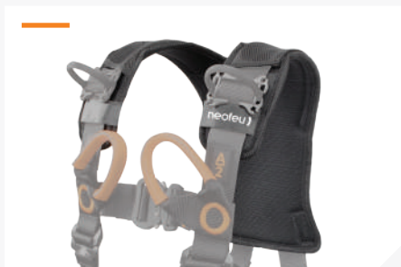
RESPALDO DE HOMBRO EXTRAIBLE CON TELA 3D TRANSPIRABLE