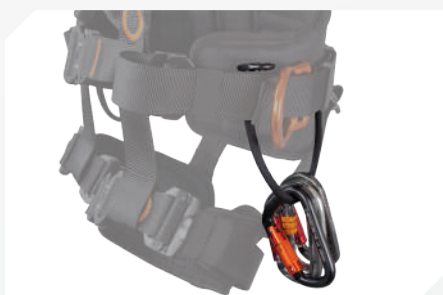
PORTA HERRAMIENTAS (X2) + CORREAS PARA HERRAMIENTAS GRANDE (X3)