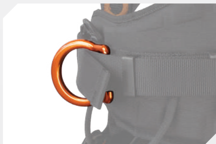
PUNTOS DE ANCLAJE LATERALES DE ALUMINIO PARA TRABAJO DE MANTENIMIENTO PIVOTANTE