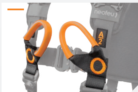
PUNTOS DE ANCLAJE ESTERNA CON ANILLA PARA CONECTARSE