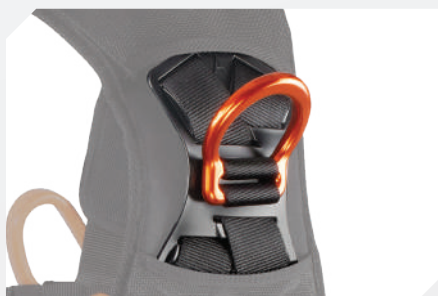
PUNTO DE ANCLAJE DORSAL POR "D" EN ALUMINIO