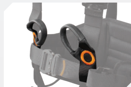
PUNTOS DE ANCLAJE VENTRAL PARA TRABAJO DE MANTENIMIENTO CON ANILLA PARA CONECTARSE