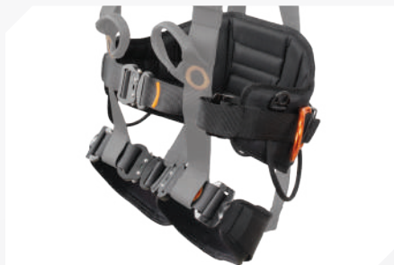
PERNERAS Y CINTURÓN DE MANTENIMIENTO CON TELA 3D TRANSPIRABLE