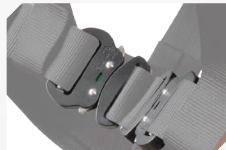
HEBILLAS DE BLOQUEO AUTOMÁTICO EN ALUMINIO CON TESTIGO DE CIERRE