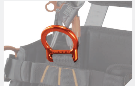
ANILLA VENTRAL PARA TRABAJO EN SUSPENSIÓN DE ALUMINIO