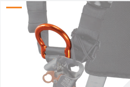
ANILLA EXTERNAL DE ALUMINIO