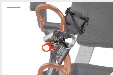
TENSOR DE BLOQUEADOR INCLUIDO REF. NUS131A + BLOQUEADOR VENTRAL EN OPCIÓN REF. NBLOCK