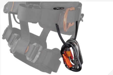
PORTA HERRAMIENTAS (X2) + CORREAS PARA HERRAMIENTAS GRANDE (X3)