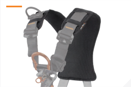
RESPALDO DE HOMBRO CON TEJIDO 3D TRANSPIRABLE