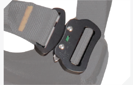
HEBILLAS DE BLOQUEO AUTOMÁTICO EN ALUMINIO CON TESTIGO DE CIERRE