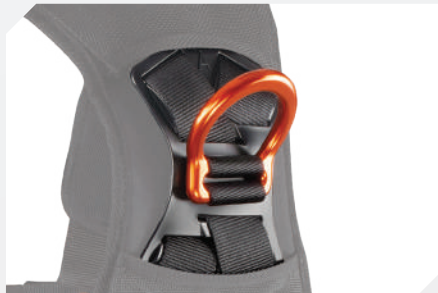
ANILLA DORSAL DE ALUMINIO