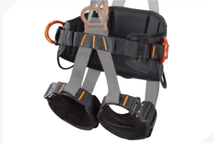
PERNERAS ANCHAS Y CINTURÓN DE MANTENIMIENTO CON TELA 3D TRANSPIRABLE