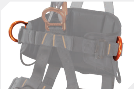
ANILLAS LATERALES PARA TRABAJO DE POSICIONAMIENTO EN ALUMINIO