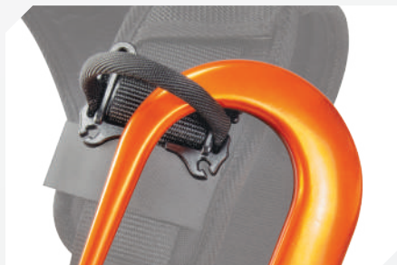
ANILLO PORTA GANCHO