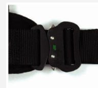
Hebillas auto aluminio con testigo de clausura